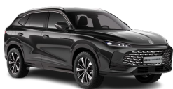
● PEBBLE BLACK (METALICKÁ FARBA NA OBJEDNÁVKU)

Metalické a farby sú za príplatok vo výške 600 EUR s DPH