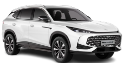
○ WHITE PEARL (METALICKÁ FARBA NA OBJEDNÁVKU)