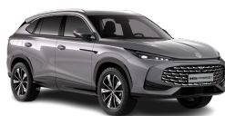
● HAMPSTEAD GREY (METALICKÁ FARBA NA OBJEDNÁVKU)